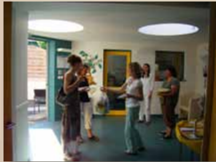
La fête de fin d'année de la crèche