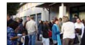
A l'école élémentaire