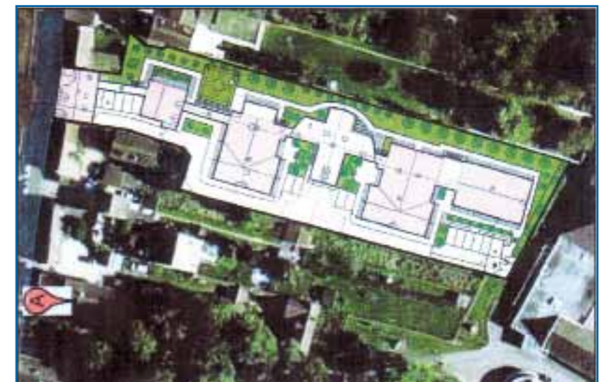
Un bâtiment tout en longueur

des représentants de la Commune de Vert-le-Grand, de BVRV, de la MSA Ile-de-France, du Conseil Général, de la société Athénée, des professionnels de la santé, des communes associées et des usagers.