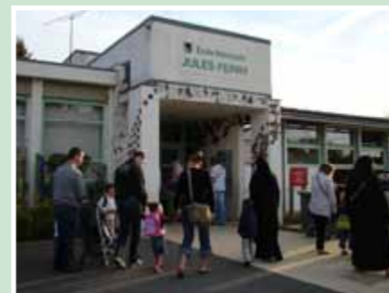
A l'école maternelle