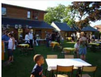
Vernissage de l'exposition « Souvenirs du Mali », le 16 avril